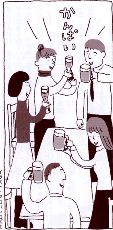
イラスト・タカハシカズエ